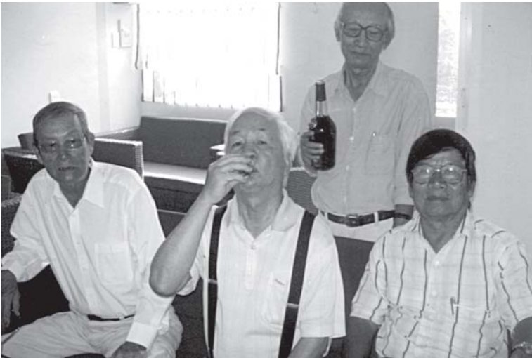
D.KIẾN LÀ NGƯỜI ĐẦU TIÊN ĐƯỢC HƯỞNG...