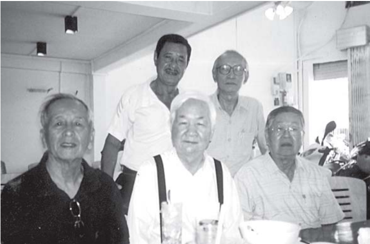
HỌP MẶT VỚI D.KIẾN ĐỨNG: NGŨ - QUÂN - NGỒI: THẮNG - KIẾN - PHIÊN