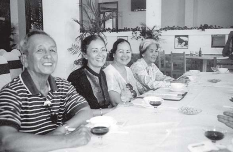
CÙNG ĐÓN XUÂN VỀ TẠI VŨNG TÀU CÙNG GIA ĐÌNH QUYÊN VÀ GIA ĐÌNH THỦY