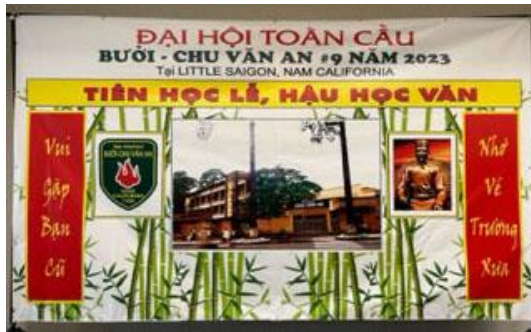
Banner Đại Hội Bưởi-Chu Văn An Toàn Cầu.

Sơ qua về cách tổ chức, năm nay đặc biệt được điều hành bởi một Ban Tổ Chức với các đồng môn rất trẻ, ra trường năm 1978 là năm cuối cùng khi trường Chu Văn An bị giải thể. Cũng vì thế bức hình trường học bên dưới là ngôi trường mới, không phải ngôi trường bọn CVA59 mình đã học, trên đường Trần Bình Trọng, ở phía sau trường Petrus Ký.